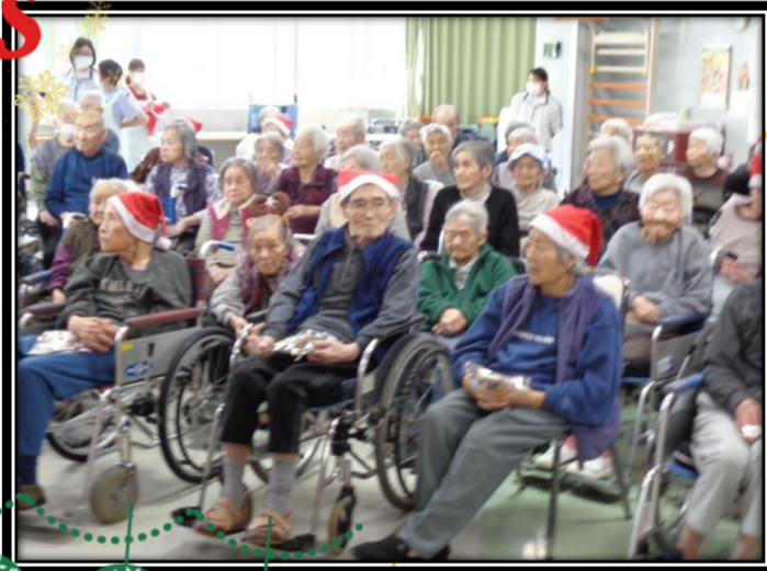
帽子をかぶって 雰囲気作り♪